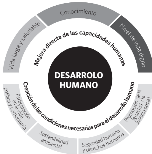
Figura 1. Dimensiones del desarrollo humano.