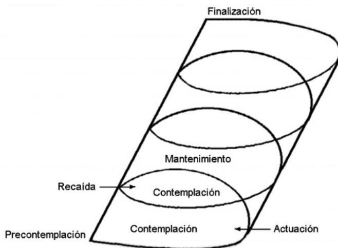
Figura 1. Modelo transteórico de cambio en espiral.